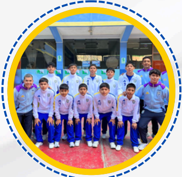
CAMPEONES MACROREGIONALES FUTSAL VARONES CATEGORIA B