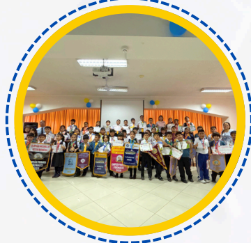
GANADORES EN DIFERENTES CONCURSOS DE CONOCIMIENTOS - NIVEL PRIMARIA