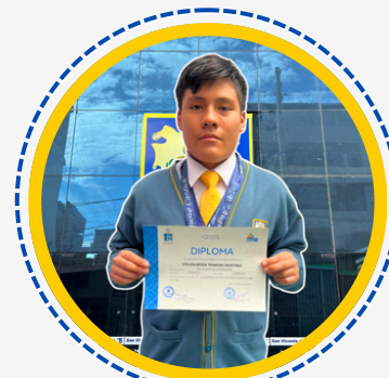
2º PUESTO EN LA ETAPA DRE HCO RUMBO A LA NACIONAL - ONEM 2026