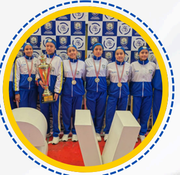
CAMPEONAS COPA ALLPA 2025 SUB 13