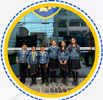
GANADORES EN DIFERENTES CATEGORÍAS EUREKA