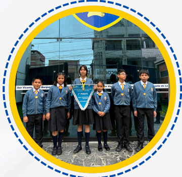
GANADORES EN DIFERENTES CATEGORÍAS EUREKA