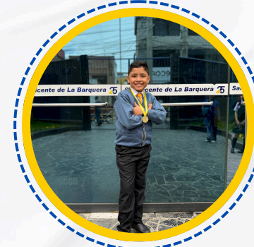
GANADOR EN CONCURSO NACIONAL DE NARRATIVA Y ENSAYO