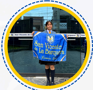
GANADORES EN EL SUDAMERICANO DE CIENCIAS Y TECNOLOGIA PARAGUAY - CELE 2025