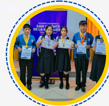
GANADORES EN DIFERENTES CONCURSOS DE CONOCIMIENTO - NIVEL SECUNDARIA