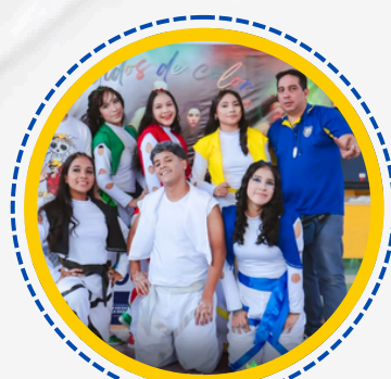
CAMPEONES REGIONALES BAILE URBANO