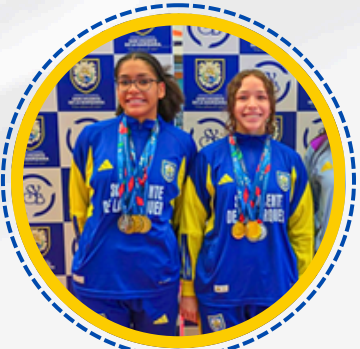
CAMPEONAS MACROREGIONALES EN NATACIÓN