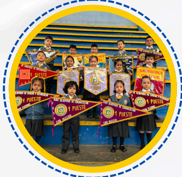
GANADORES EN DIFERENTES CONCURSOS DE CONOCIMIENTO - NIVEL INICIAL